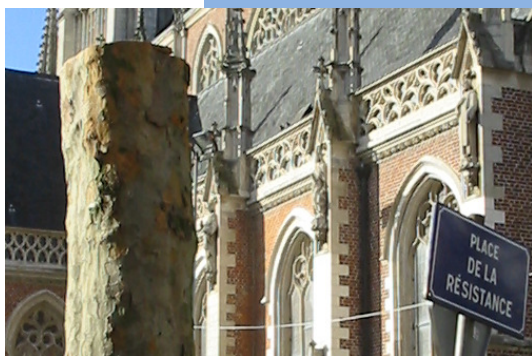
Place de la Résistance, les arbres morts au combat.